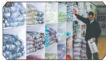
Yün İplik Departmanı; "Örmeye değer" yüzlerce çeşit...