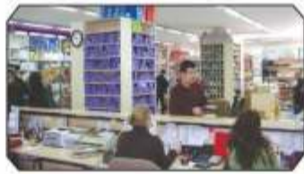
Pazar günlerini de kapsayan kesintisiz hizmet anlayışı...