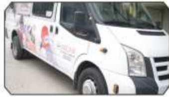
Ücretsiz Kargo hizmeti