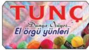
AKCAN imalâtı Tunç el örgü yünleri