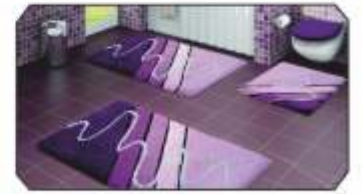
AKCAN Garantili Confetti Halılar