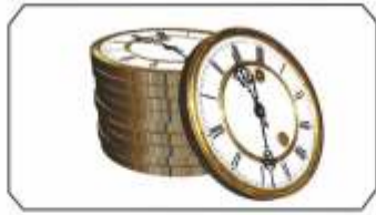
Uygun fiyat ve vade seçenekleri