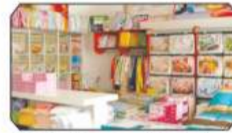
Ev Tekstili Departmanı binbir renk ve desenden çizgi film karakterlerine...