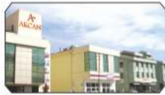
25.000 Metre Kare Kapalı alana yayılmış, 5 ayrı binada rahat seçim imkanı