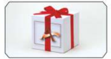
Kâr artırmaya yönelik, bol seçenekli kampanya ve promosyon çeşitleri