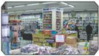
Tuhafiye Departmanı; her zevke, her bütçeye