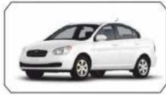
Mobil Satış Ekibi ile yerinde hizmet