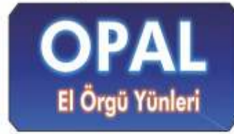
AKCAN imalâtı Opal akrilik yünleri