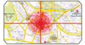
Şehir merkezinde, kolay ulaşım