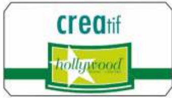
AKCAN imalâtı Hollywood ve Creatif Ev Tekstili ürünleri