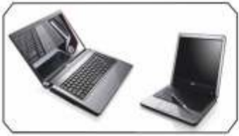
Bayiye yerinde, güvenilir ve hızlı bilgi akışı hizmeti